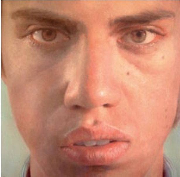
Identità, cm 21x21, olio su tela, 2010